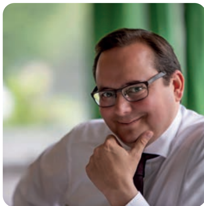
Thomas Kufen CDU, Oberbürgermeister der Stadt Essen